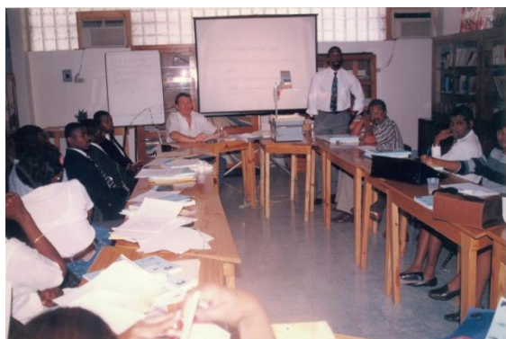
Programme Haïti 1996-2002